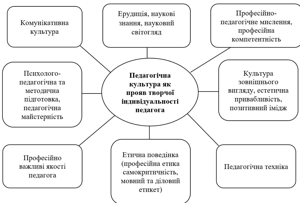
Рис. 2.1. Складові педагогічної культури особистості